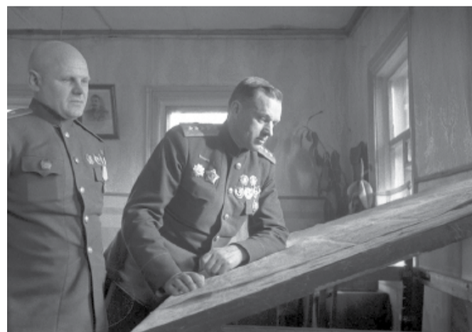
Сегодня улица названа именем маршала Константина Рокоссовского (справа).

Но блестящая военная карьера рухнула летом 1937 года, когда его исключили из партии, уволили из армии и арестовали, обвинив в связях