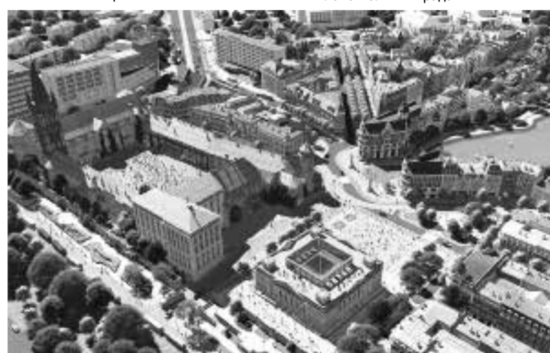
Полоса подготовлена по материалам пресс-службы администрации Калининграда

Цель конкурса – дать обоснованное урбанистическое, градостроительное и объёмно-пространственное решение для территории бывшего орденовского замка Кёнигсберг. Итоги конкурса будут являться основанием для разработки документации по планировке территории в указанных границах и лягут в основу корректировки Генерального плана Калининграда. ■