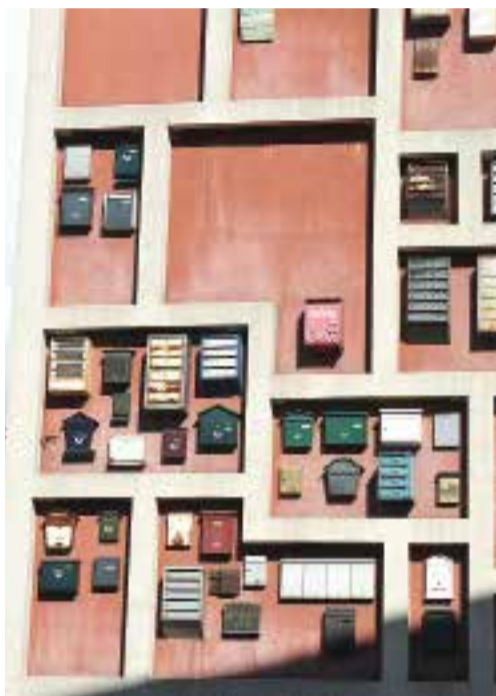
Оригинальный Музей почты под открытым небом.

Маршал был статен, красив и чрезвычайно обаятелен. Его имя постоянно упоминалось в разных любовных историях. Ему приписывают, к примеру, роман с советской актрисой Валентиной Серовой (кинофильмы «Сердца четырёх», «Жди меня»). И с годами появилось большое количество фальшивых «сыночек и дочерей маршала».