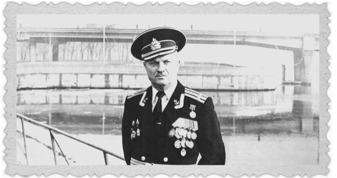
Комендант Калининградского гарнизона, капитан первого ранга Владимир Ткачёв. 1985 год.

Атака была немой: советские моряки открыли ракетные ангары, но они были пусты. Только американцы-то об этом не знали!