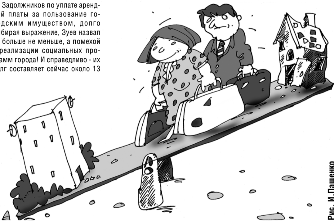
Рис. И. Пашенко