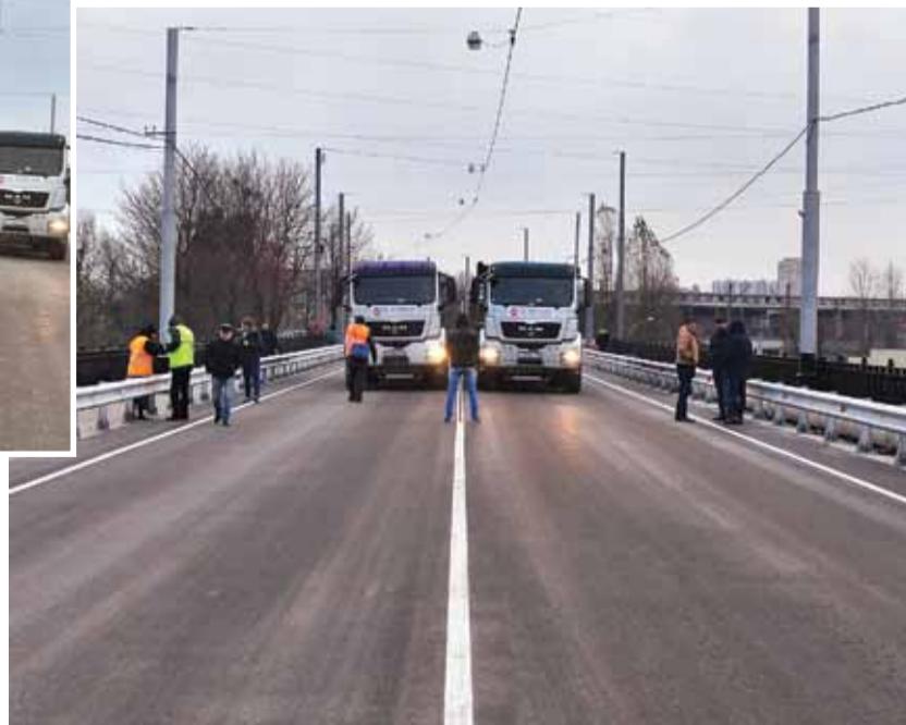
Специалисты «ГДСР» измерили параметры сооружения под нагрузкой на каждом пролёте.

Главное — движение по мосту открыли на месяц раньше срока. Поздравляю всех калининградцев!»