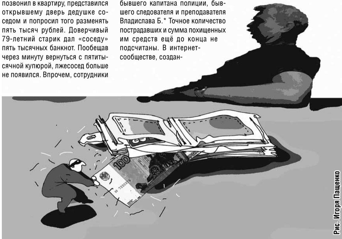
Рис. Игоря Пащенко

коммерческой недвижимости, куда будут выгодно вложены их средства. Попробовав вложить небольшие деньги, люди быстро убеждались, что проект приносит неплохие дивиденды и спешили вложиться дополнительно, чтобы не упустить удачу. В результате некоторые передавали ему собственные сбережения, а некоторые даже брали банковские кредиты, подсчитав, что разница между теми средствами, которые