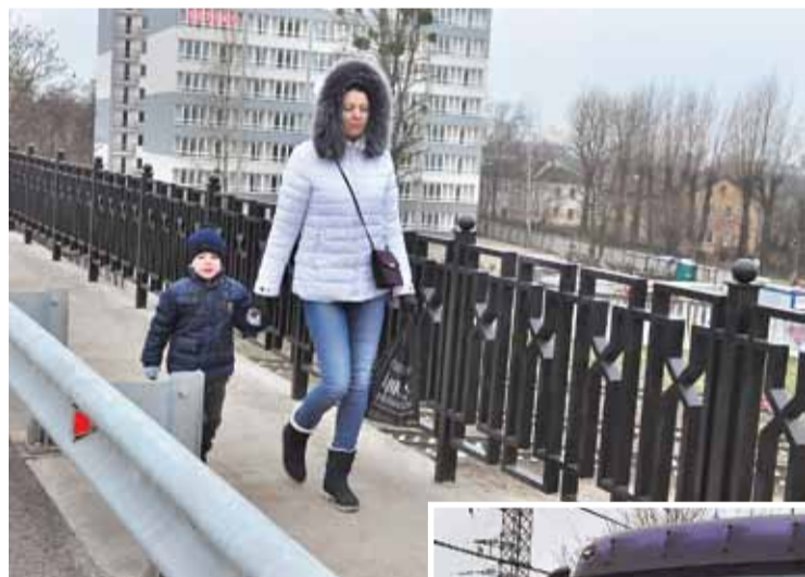
Тротуары на мосту по улице Суворова стали удобнее.

Два многотонных грузовика до отказа нагруженные песком испытали новый мост на прочность. По команде автора проекта реконструкции этого сооружения, доктора технических наук, профессора Александра Прокофьева они остановились на первом пролёте. Специалисты МКУ «Городское дорожное строительство и ремонт» сделали замеры и сравнили их с показателями конструкции без нагрузки. Зафиксированный прогиб (нормальное явление при работе любого моста) составил всего полтора миллиметра, что значительно меньше, чем допускается нормами.