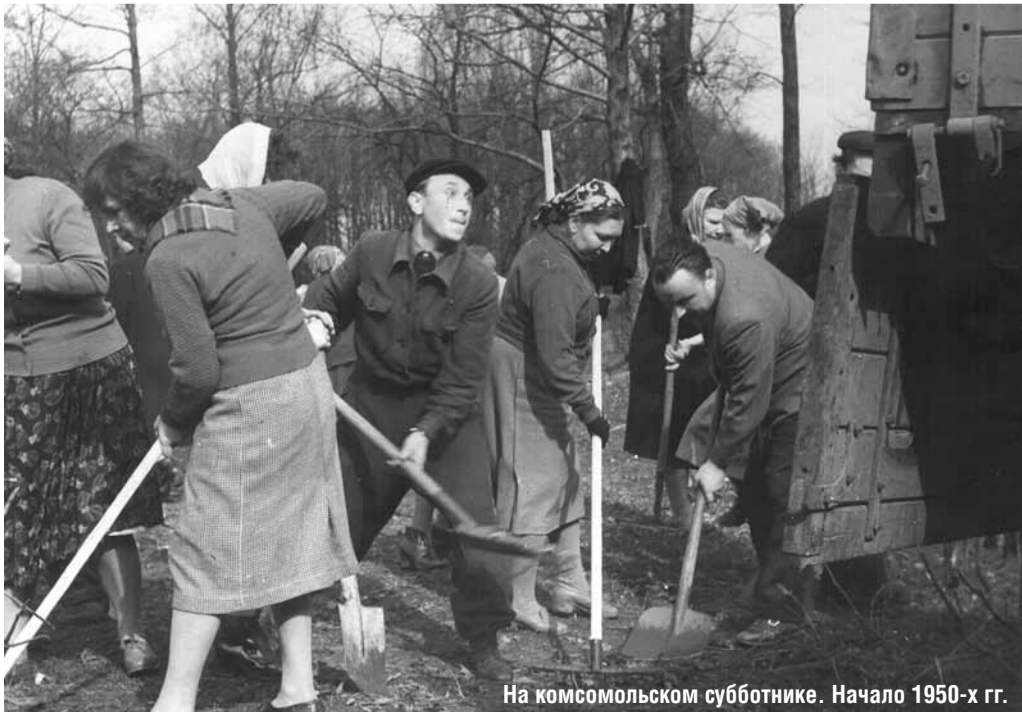
На комсомольском субботнике. Начало 1950-х гг.