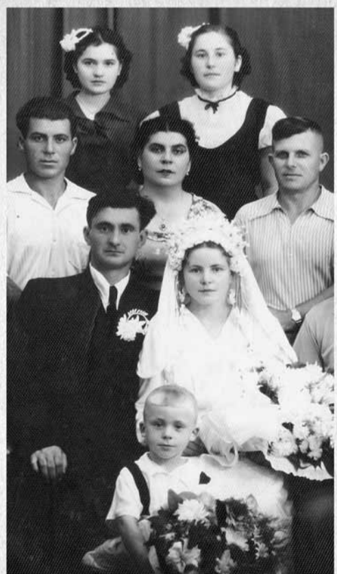
Одесская свадьба. 1958 год.