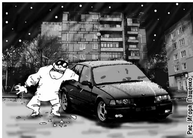
Рис. Игоря Паденко

Пару месяцев назад во дворе дома по Ленинскому проспекту вор разбил стекло «БМВ» и похитил из салона сумку с планшетным компьютером стоимостью 50 тысяч рублей.