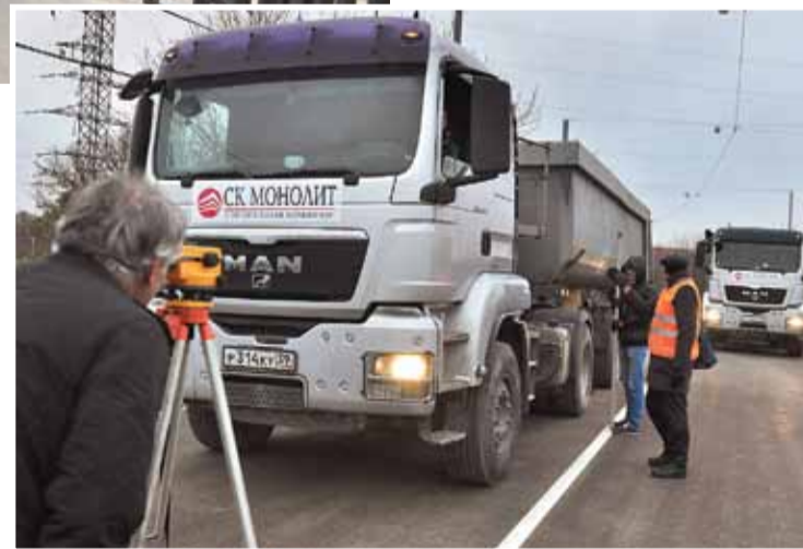
Испытания на прочность прошли успешно!

Да, мы собирались делать третью полосу движения, реверсивную. Но остались две полосы, как и было. Зато есть расстояние для объезда, если на мосту случится какая-то авария.