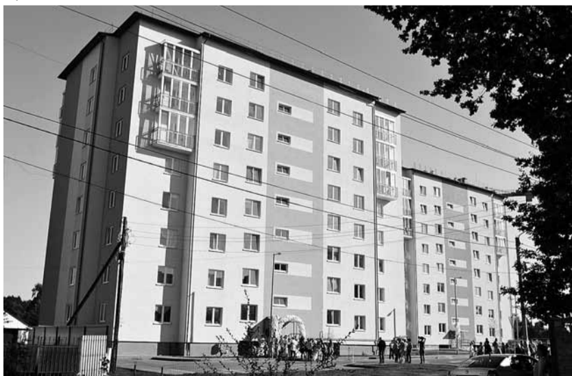
В Калининграде «аварийщики» получают только новое жильё. Программа рассчитана до 2020 года.