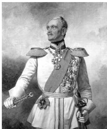
Генерал-фельдмаршал Фридрих Эрнст фон Врангель.

В начале прошлого века вдоль оборонительного кольца в Кё-