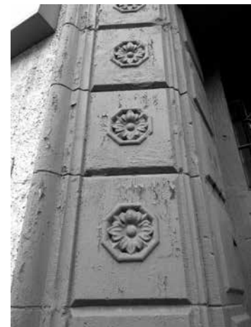
Украшение с парадного входа в дом №17 по ул. Черняховского.

Во Вторую мировую лицей сгорел. А в классах народной школы