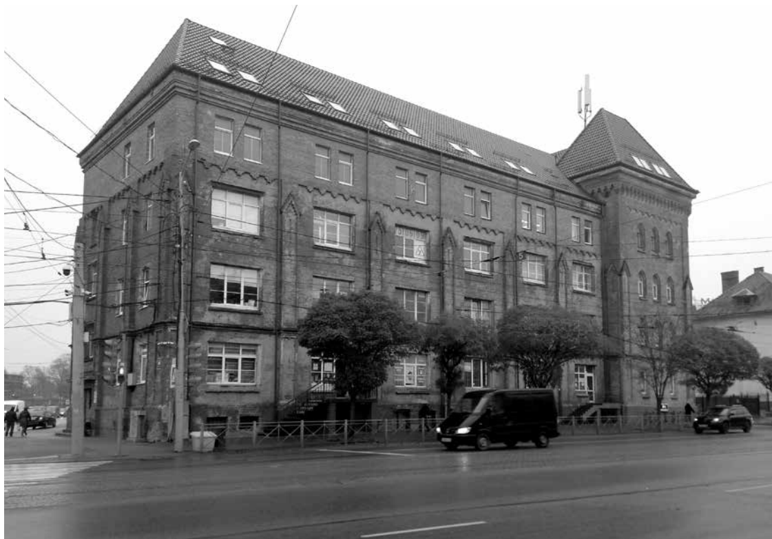
Правое крыло казармы элитного кирасирского полка «Граф фон Врангель».

СССР, разместив на базе бывшей спирто-ликёрной фабрики Карла Мендталя. «Ликёрка», как звали завод в советские годы, ежегодно производила 7 млн литров разных водок, ликёров и настоек. Разливали также пунш и даже рижский бальзам.