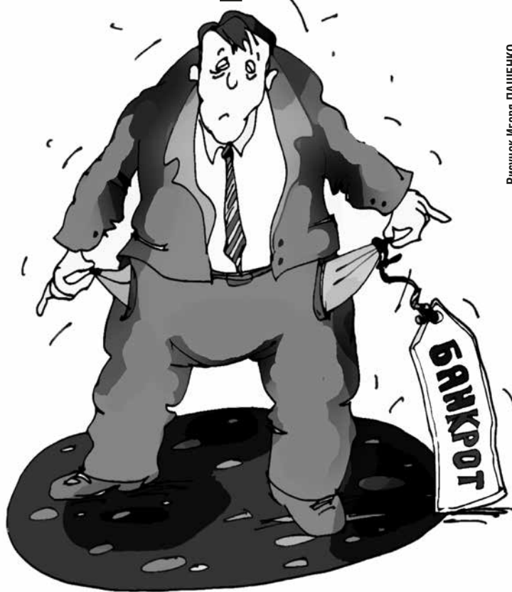
Рисунок Игоря Пашенко.

Личное банкротство в России введено в октябре 2015 года. На данный момент в стране несостоятельными признаны более 240 тысяч человек. В нашей области — около 2350 банкротов. В 2020 году суды вынесли на 65% решений о банкротстве больше, чем годом ранее (данные сайта Федресурс). В Калининградской области - почти на 68%.