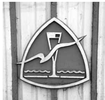
Эмблема ликёро-водочного завода на воротах.

Цейхгауз — это склад, где кирасиры хранили обмундирование, вооружение и продовольствие. А сами кирасиры — это тяжёлая ка-