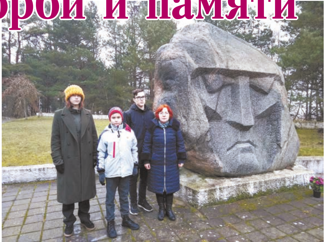
Хутор Алкснине на Куршской косе (Литва).