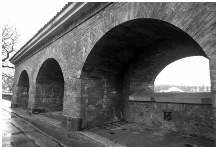
Боевая позиция артиллерийской батареи 19 века на Верхнем озере.

Воды Верхнего озера по водоводу под дорогой и каскаду устремляются в Нижний пруд, потом в Преголю. Промзона за каскадами - бывший ликёро-водочный завод, который образовали в октябре 1946 года по приказу Министерства вкусовой промышленности