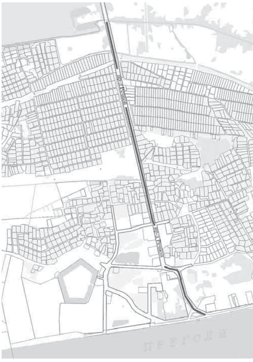
Схема расположения проезда Речного

Приложение к решению городского Совета депутатов Калининграда от 18.04.2018 №69