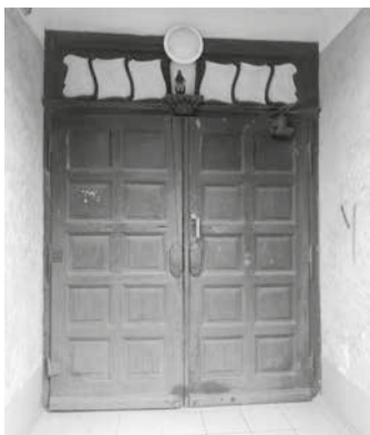
Один из входов в отель «Дрезднер хоф». Дверь, хоть давно и не мытая, зато аутентичная, довоенная.