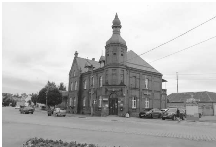
На площади по-прежнему, как и сто двадцать три года назад, работает почта.