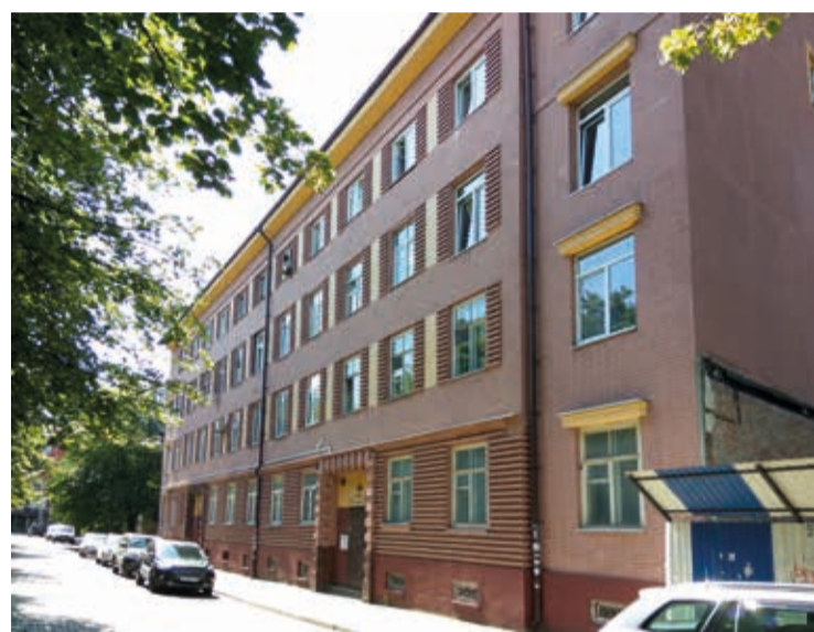
Здание бывшего телеграфа (№17) легко узнать по окнам с «распахнутыми ставнями».

Чайковский скитался по Европе, творил, затем осел в Клину (там