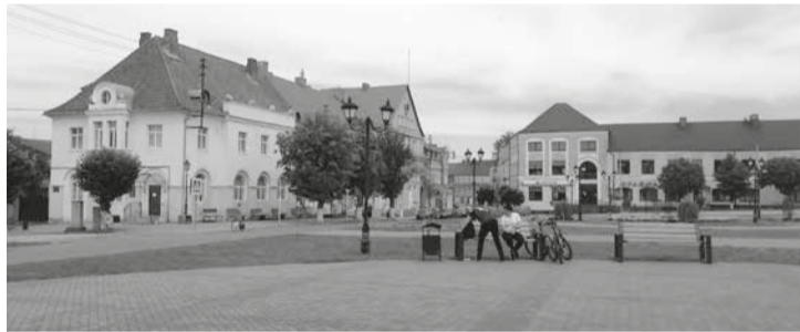
Фрагмент главной площади Озёрска.

Педантичные немцы, любившие (и любящие поныне) считать и пересчитывать деньги, зафиксировали, что общий ущерб городу от Наполеоновских войн составил более 33 тысяч талеров.