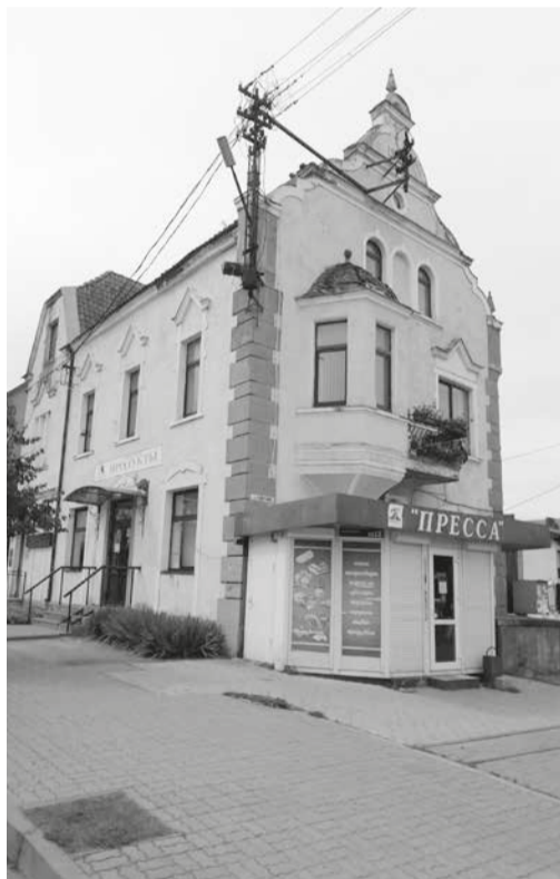
Тот самый дом Густава Корта.

Здание «Дрезднер хофа» восстановили на средства «Дрезденского союза помощи для города и района Даркемен».