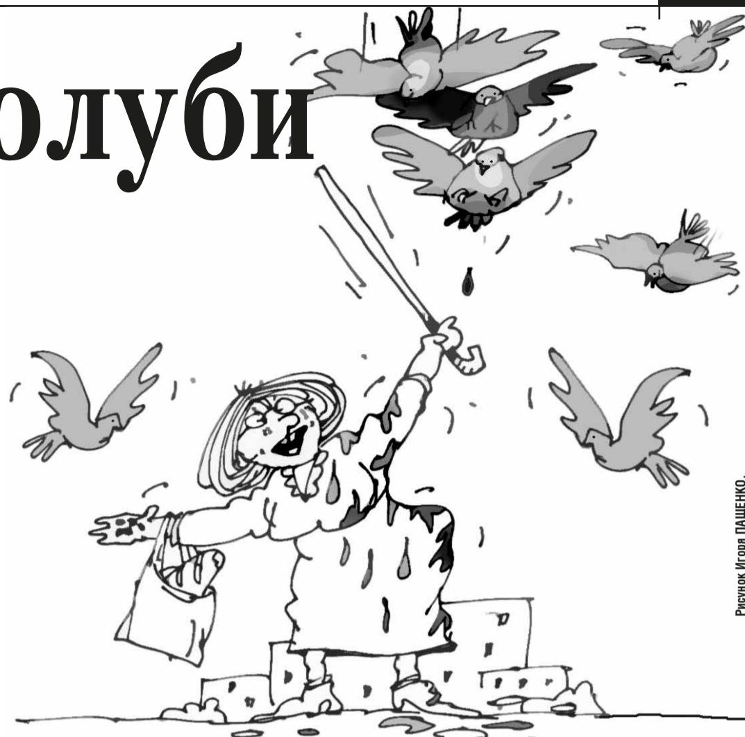
Рисунок Игоря ПИЩЕНКО.

Кстати, врачи, в том числе Роспотребнадзора, просят не трогать травмированных голубей. Травма крыла или лап на деле может оказаться параличом от туберкулёза.