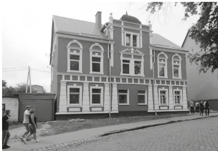
Это красивое двухэтажное здание с мансардой построено в Даркемене на Гумбиннер-штрассе в начале XX века.