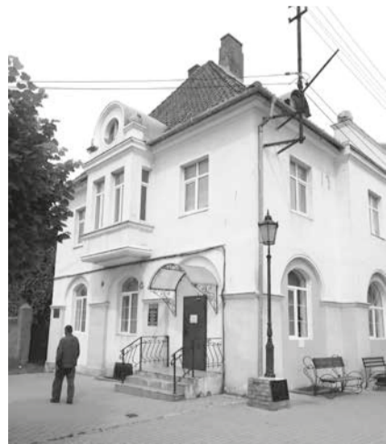
Памятник фонарю у местного ЗАГСа в честь появления в 1886 году в Даркемене уличного освещения (первого в Восточной Пруссии).

Появление в 1880 году в Даркемене водяной электростанции дало новый толчок в развитии города. Ток вырабатывался турбиной, мощностью 30 лошадиных сил, построенной на трёхметровом перепаде Ангераппы. Благодаря этой электростанции в Даркемене уже в 1886 году заработало уличное электрическое освещение (первое в Восточной Пруссии!). Вначале 16 дуговых ламп.