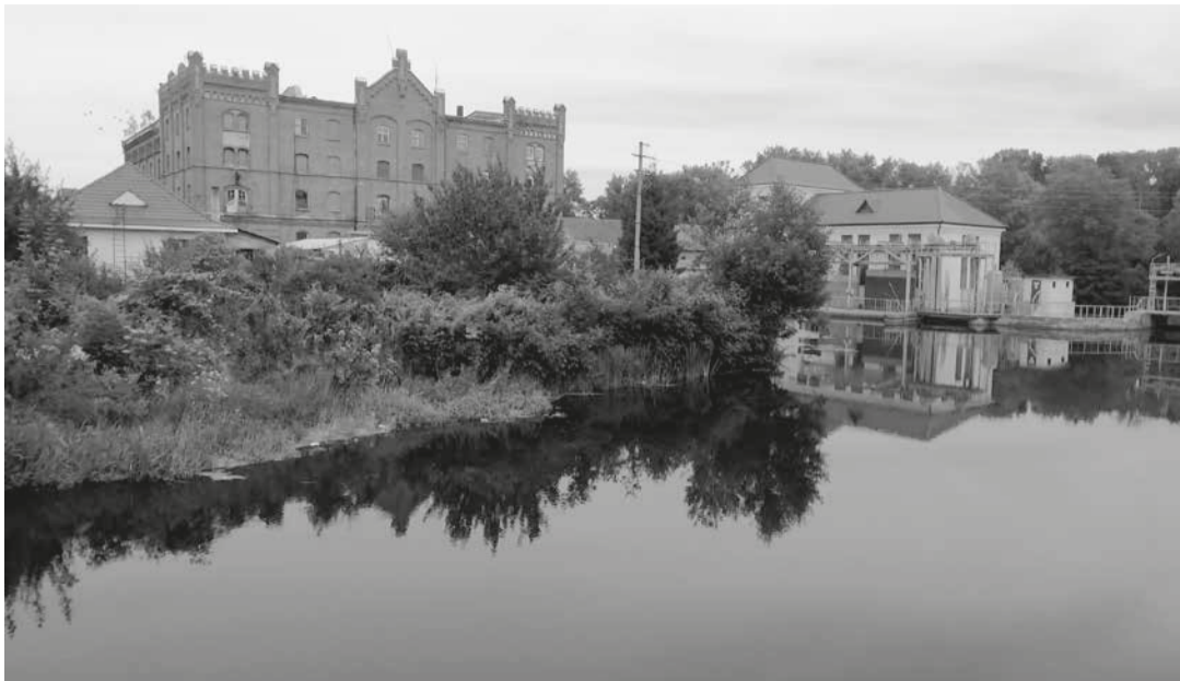
Вид на мельницу Вихерта со стороны реки Анграпа. Чуть правее — электростанция.

По соседству с великолепной виллой Вихерта находится мощное здание мельницы, построенное им же в 1898 году. Эта мельница считалась самой технически совершенной в Восточной Пруссии, выдавала первосортную дешёвую муку, которая шла в Швецию.