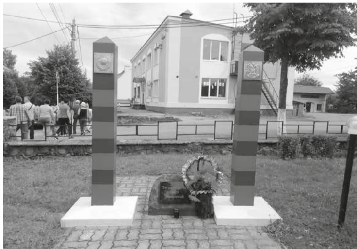
Памятный знак «Пограничникам всех поколений» в центре Озёрска.