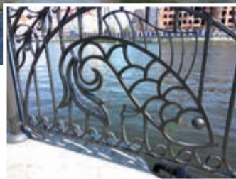
На ограждении набережной изображён знаменитый сом из Преголи.

декоративные кронштейны, поддерживающие плиту карниза). Есть сведения, что до войны в здании размещались школа зубных врачей, служба дезинфекции и др. А сейчас здесь - школа искусств, одна из старейших в Калининграде (открылась ещё в 1959 году на ул. Дзержинского). В 2016-м, кстати, стала лауреатом общероссийского конкурса «50 лучших школ искусств». И носит имя Петра Ильича Чайковского (1840 - 1893).