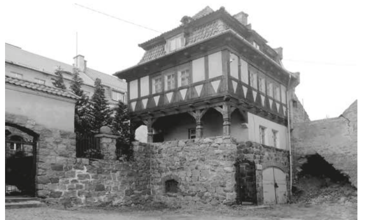
Гостевой дом как избавление от гостей.

В результате в Даркемене образовался переизбыток мощностей, который и направили на освещение улиц, магистрата, гостиниц и проч.