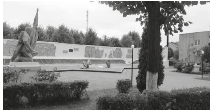
В братской могиле захоронено более 1,6 тысяч воинов. Мемориал установлен в 1949 году.

Их потомки живут и работают в Озёрске и по сей день.