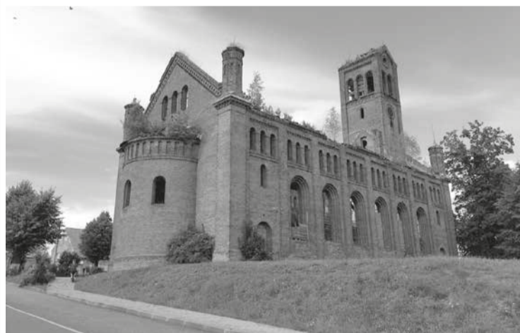
Кирха Даркемена, освящённая в 1842 году. Во время Второй мировой не пострадала. Сейчас в аварийном состоянии.