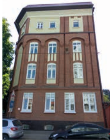
Дом №31, северный фасад. Архитектурные черты главного, восточного, фасада скрывают кроны каштанов.

После войны его восстановили частично. На фасадах сохранили ниши с ярусами окон, фронтоны, лизены (плоские вертикальные выступы на стенах), карнизы и их модильоны (такие