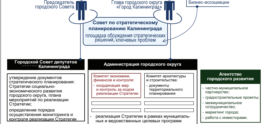
Рисунок 9. Система стратегического планирования

Обобщенно система стратегического планирования с закрепленными за отдельными ее элементами функциями представлена на рис. 9.