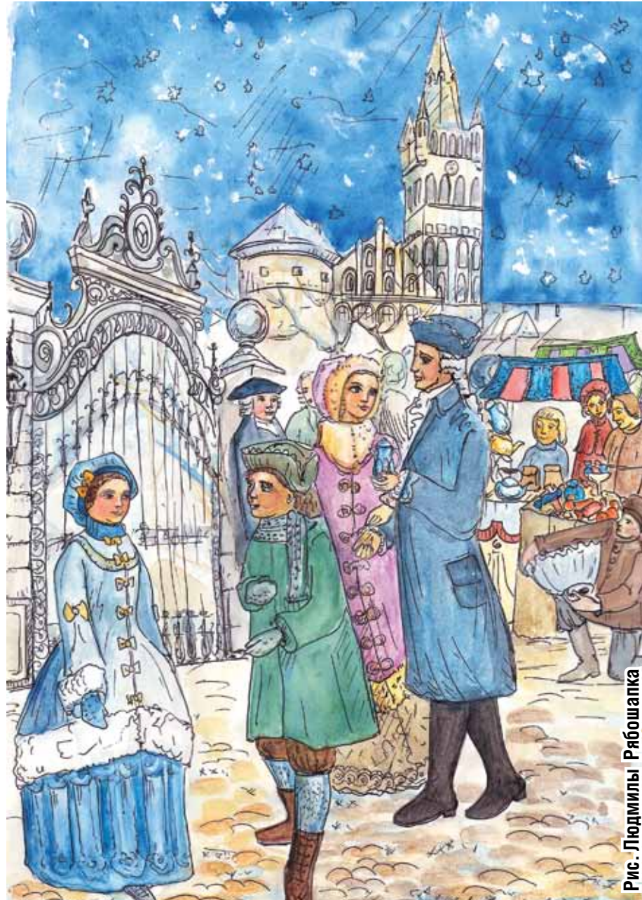
Рис. Людмила Рябошапка

Когда Эмма остановилась возле очередной лавки, разглядывая пушистого игрушечного ко-