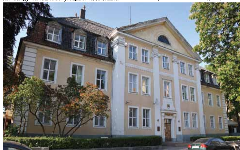
Бывшая Палата мер и весов Кёнигсберга.