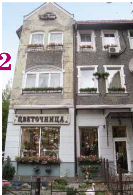
На улице ещё ощущается дыхание старого города.

Многие пожилые калининградцы нет-нет да и назовут эту улицу Большой Почтовой. Как она называлась сразу после войны. Вероятнее всего потому, что здесь, в доме №22 у немцев располагался переговорный пункт имени Гинденбурга (о нём в №13 «Гражданин»). Это трёхэтажное здание на углу с Герман-аллее (ул. Чайковского) возвели в 30-х годах прошлого