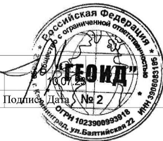
Схема расположения границ публичного сервитута Масштаб 1:500