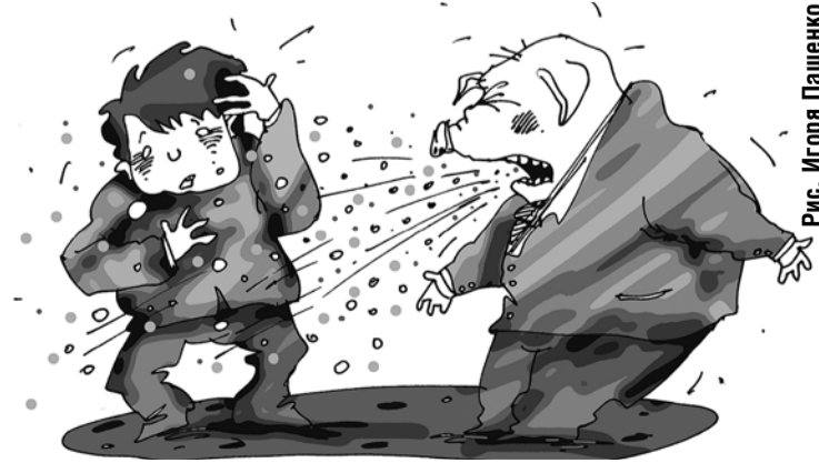
Рис. Игоря Пащенко

Очень надо беречь маленьких детей — у них несовершенная иммунная система, а также быть осторожным беременным. ■