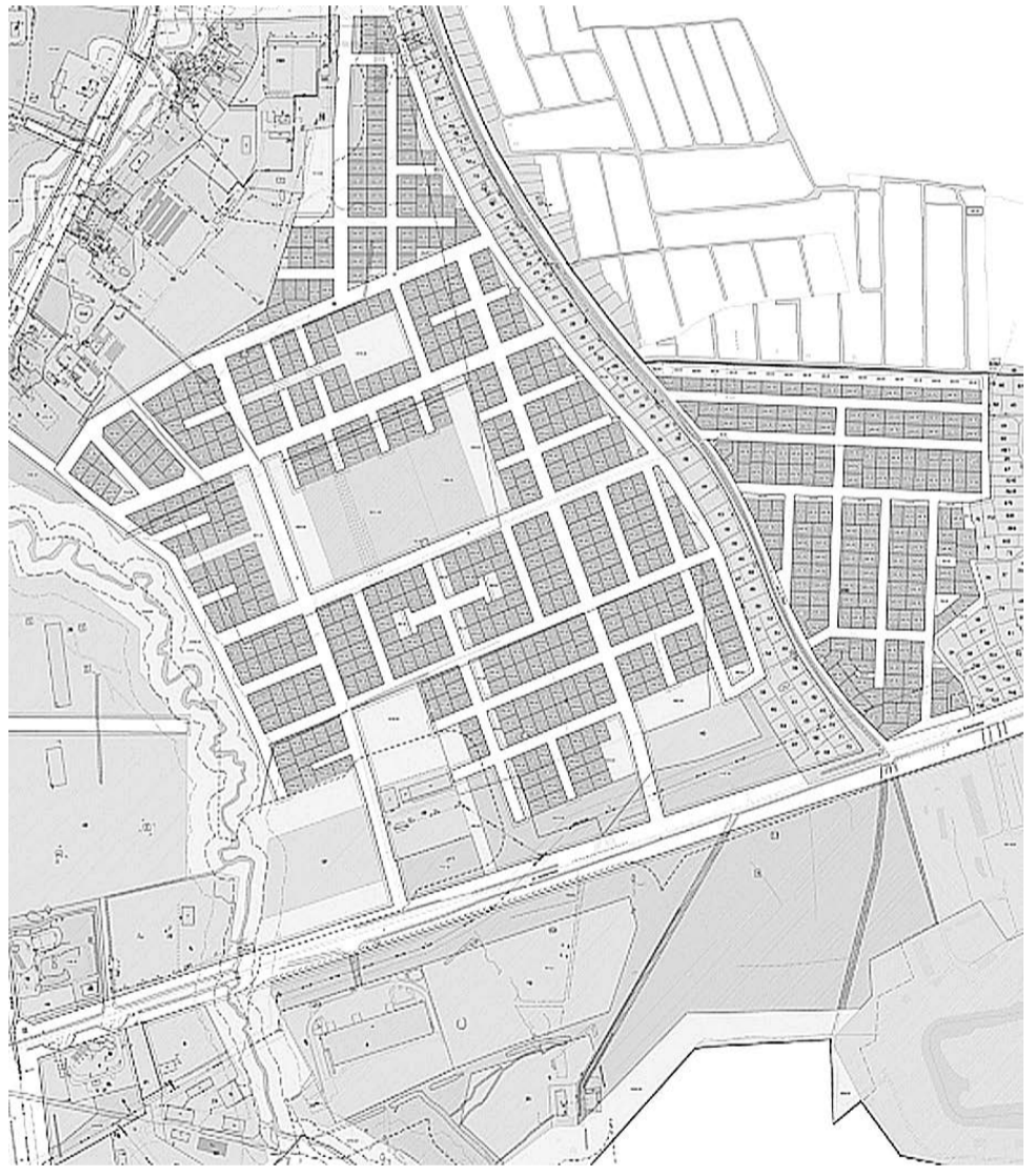
Схема расположения земельных участков, резервируемых для муниципальных нужд городского округа «Город Калининград»

Приложение №2 к постановлению администрации городского округа «Город Калининград» от 27.09.2021 г. №790