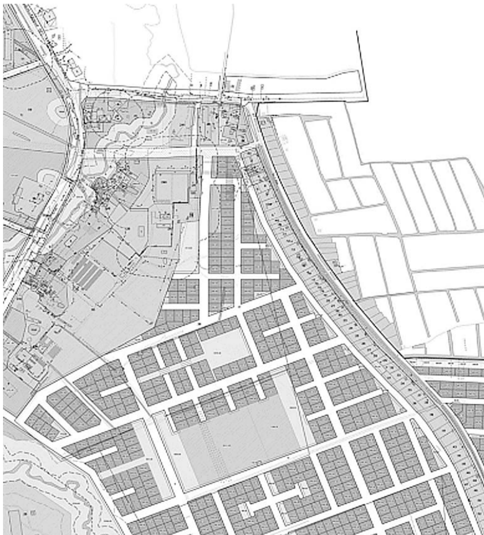
Схема расположения земельных участков, резервируемых для муниципальных нужд городского округа «Город Калининград»

Приложение №2 к постановлению администрации городского округа «Город Калининград» от 27.09.2021 г. №789