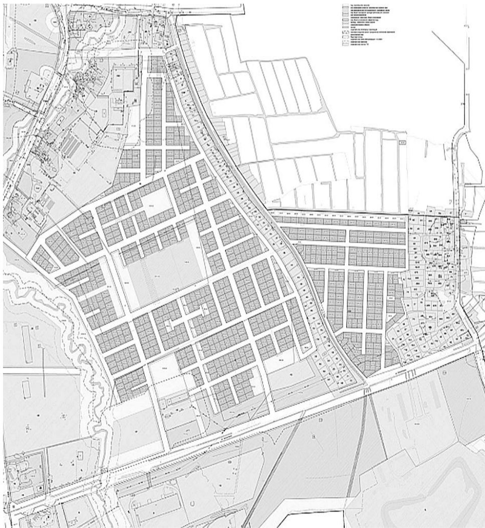
Схема расположения земельных участков, резервируемых для муниципальных нужд городского округа «Город Калининград»

Приложение №2 к постановлению администрации городского округа «Город Калининград» от 27.09.2021 г. №791